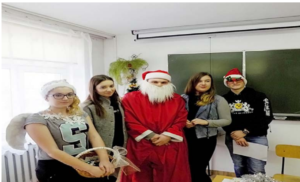
Mikołaj ze swoją świtą