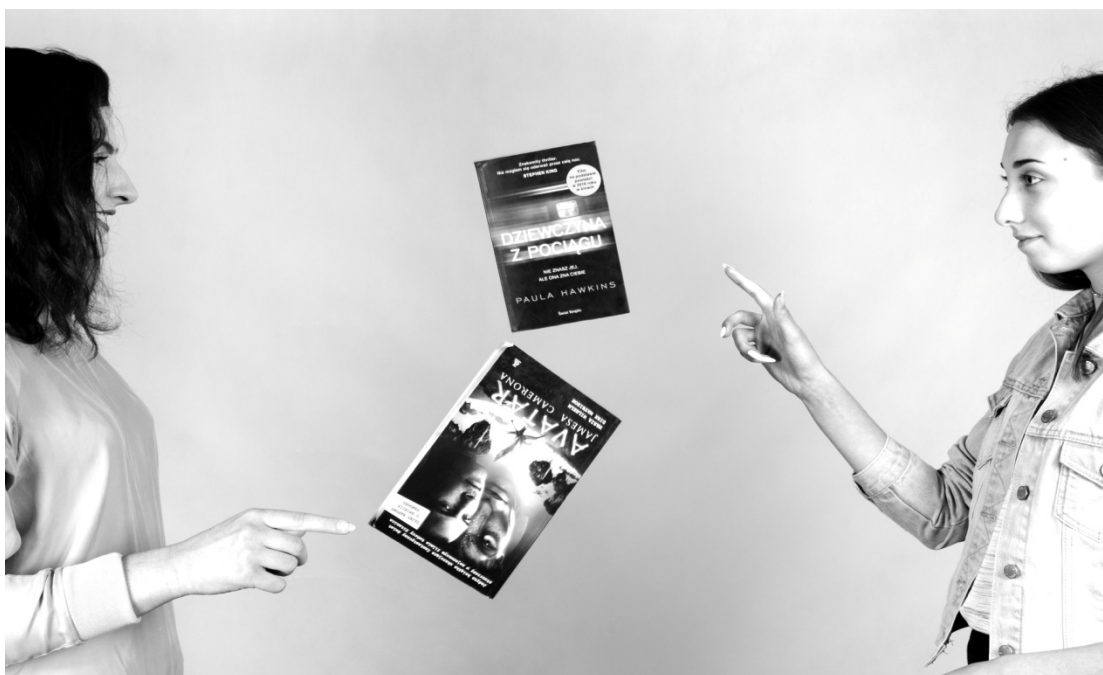
Jedna z prac fotograficznych